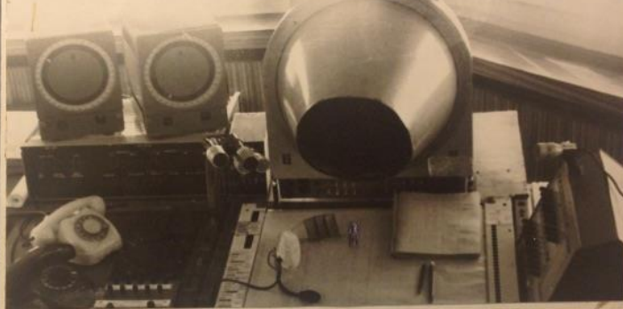
Так оборудованы диспетчерские пункты аэропорта Воркута