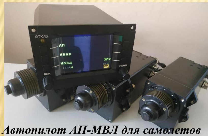
Автопилот АП-МВЛ для самолетов малой авиации разработки АО «КБПА»